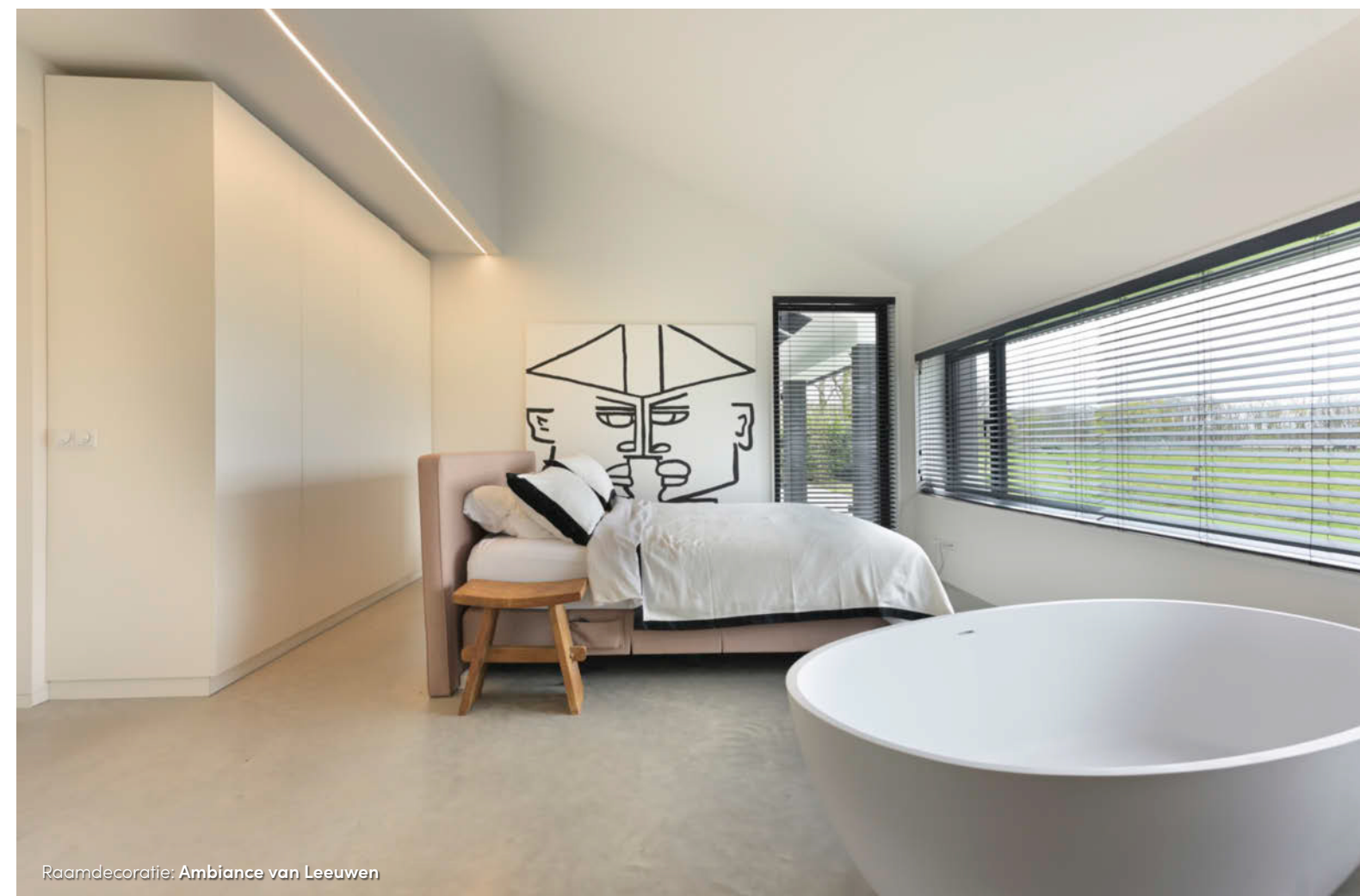
Raamdecoratie: Ambiance van Leeuwen