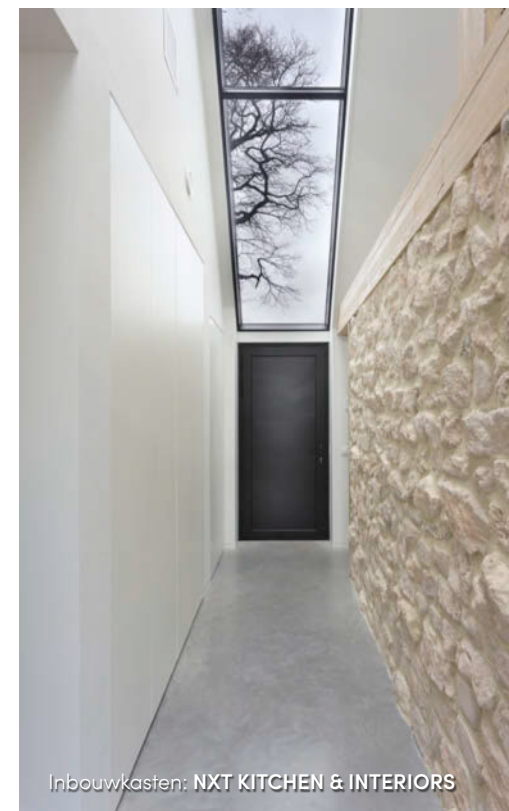
Inbouwkasten: NXT KITCHEN & INTERIORS