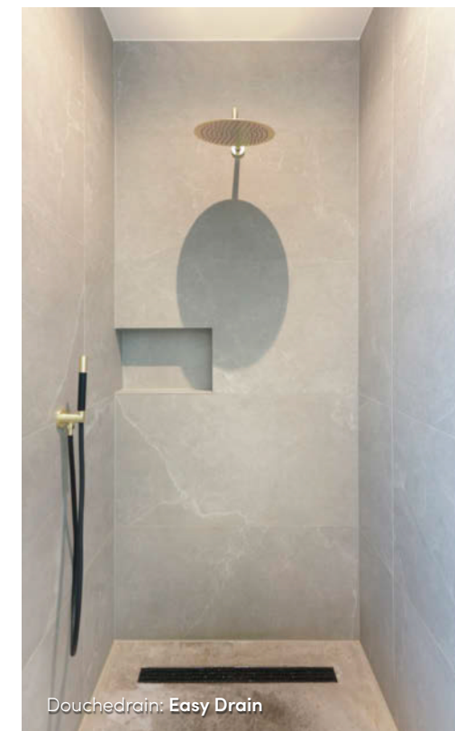
Douchedrain: Easy Drain