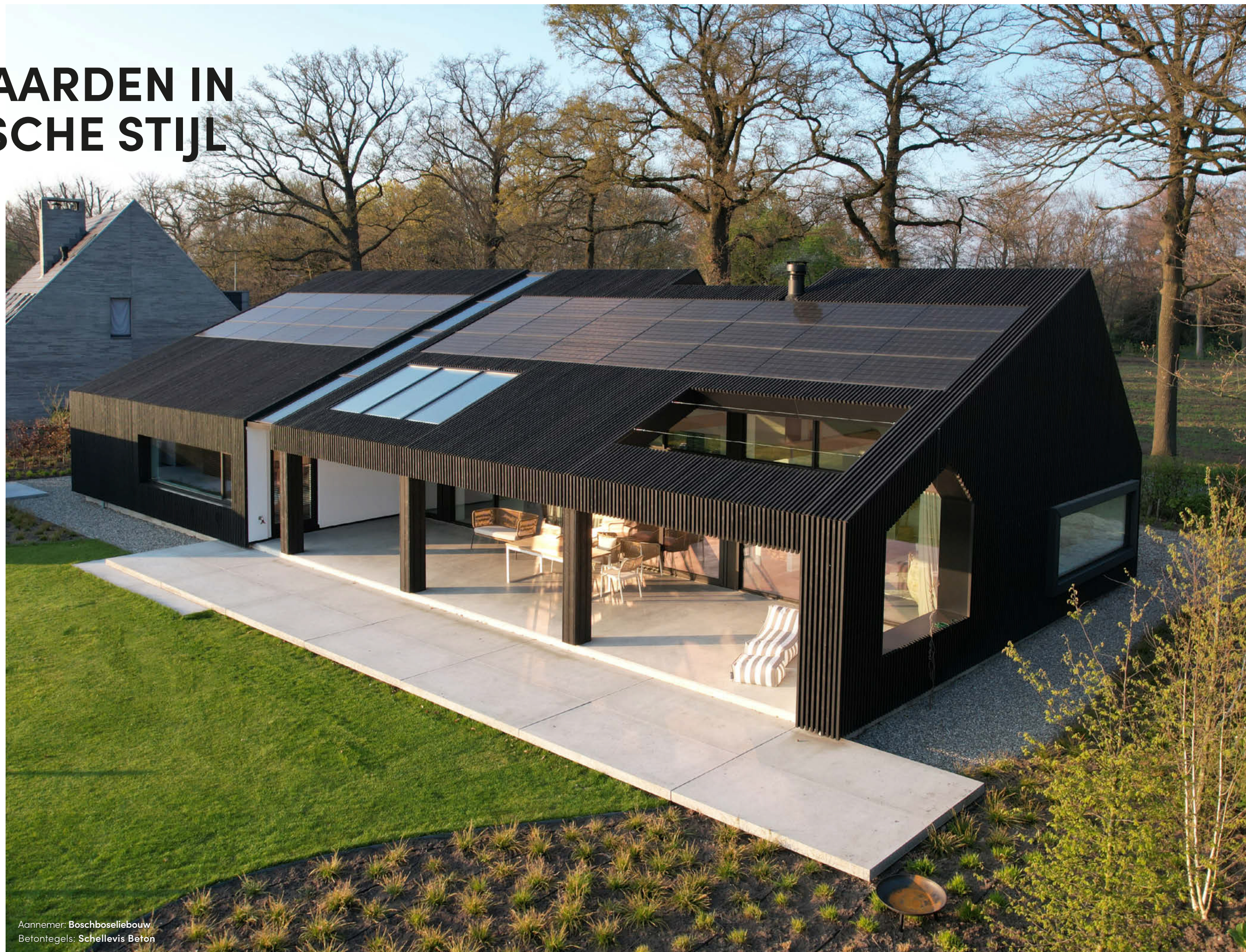
Aannemer: Boschboseliebouw Befontegels: Schellevis Beton