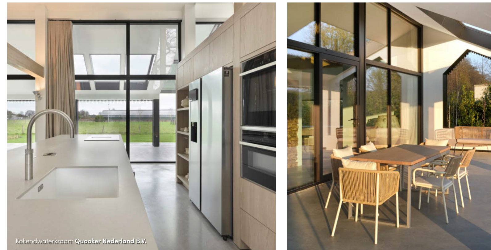
Kokendwaterkraan: Quooker Nederland B.V.